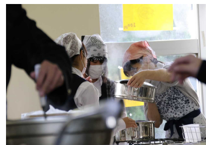
白玉ぜんざい・ふかし芋の販売