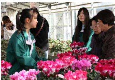
シクラメンの販売