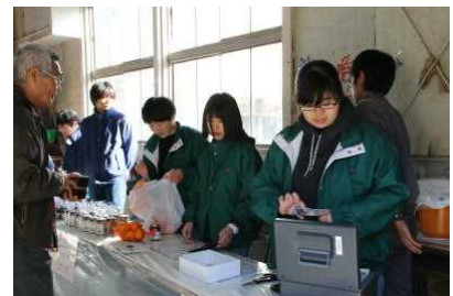
果樹苗木, ジャムの販売